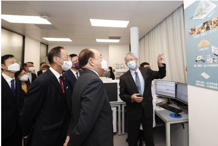
圖二：賀一誠先生考察位於香港科學園「InnoHK 創新香港研發平台」旗下一所與澳門大學合作的中藥創新研發中心。該中心旨在加快研發以中藥為本的藥物，推動本地及國際研究人員、學術機構及中醫藥業界合作。