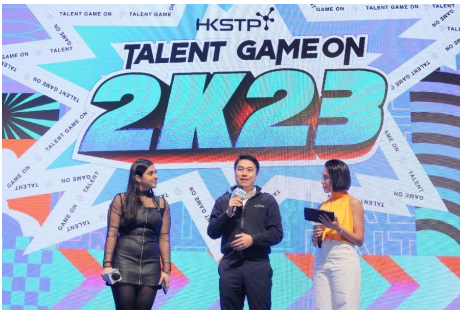
圖五：在「創科探索之旅」活動中，創科領袖在台上分享他們的勵志故事，以及如何將創新意念落實為市場方案。