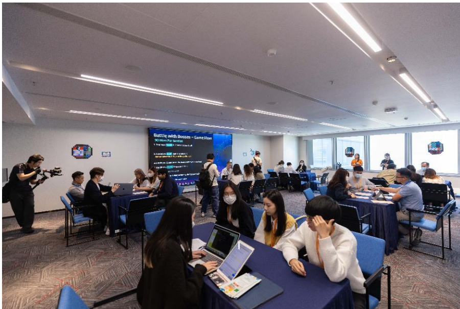
圖三：在「快閃波士」環節中，求職者與科技園的過百間園區公司進行速配面試，一展所長。