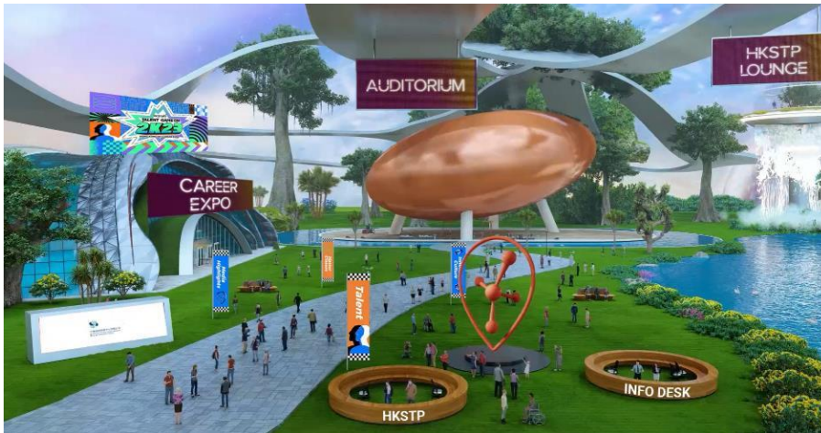
圖八：「香港創科職業博覽 2023」由即日起至 4 月 17 日期間於網上進行，有超過 250 家公司提供逾 2,500 個創科工作機會，適合不同背景和專科的本地及海外人才。