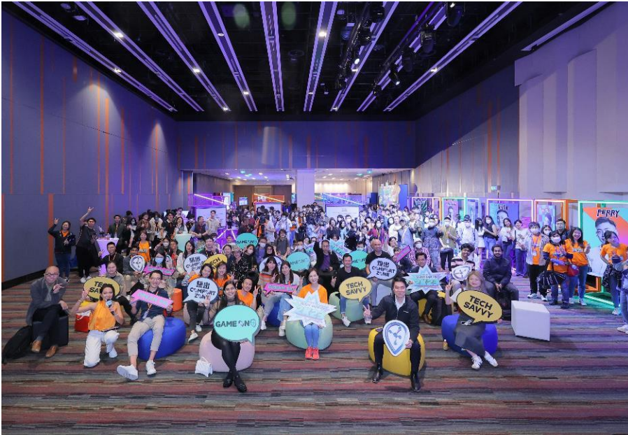
圖七：科技園「創科探索之旅」完滿結束，活動共吸引逾 500 名參加者到場。