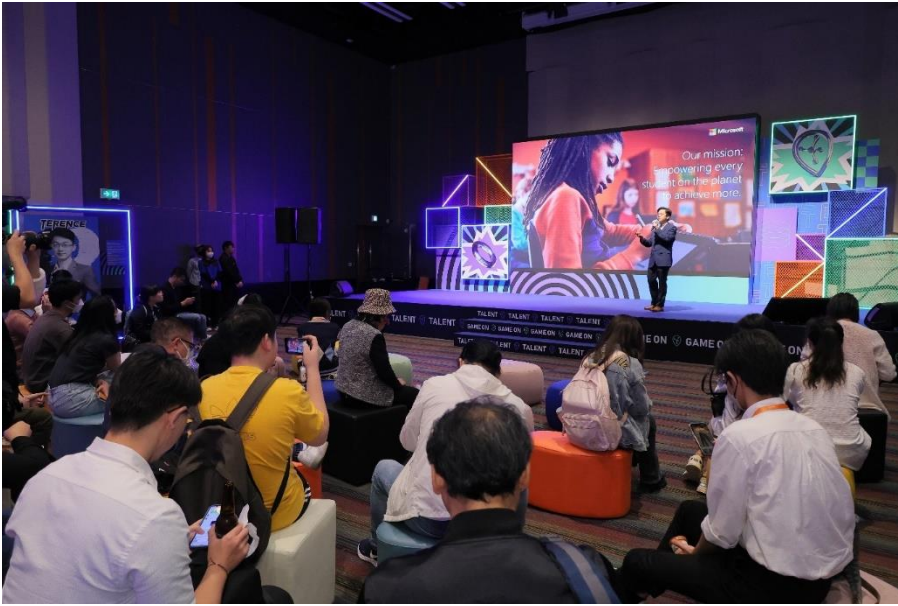
圖六：在「創科探索之旅」活動中，行業專家在台上討論熱門創科話題。