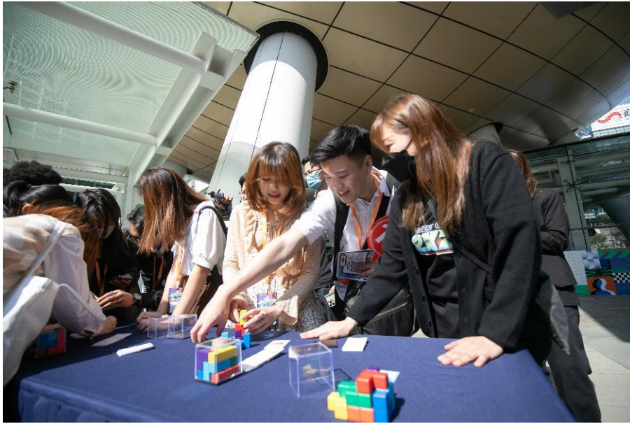
圖二：「科技大本營」的參加者透過完成不同任務，走訪並認識科學園。