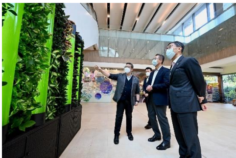
圖二至六：財政司司長陳茂波了解園區初創 Ecoinno (H.K.)、城系有限公司、Archireef 以及納米及先進材料研發院在環境可持續發展及綠色科技方面的創新產品。