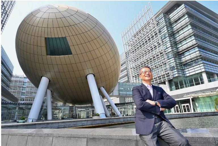
圖一：財政司司長陳茂波到訪科學園，與綠色科技初創交流，推動香港綠色發展。