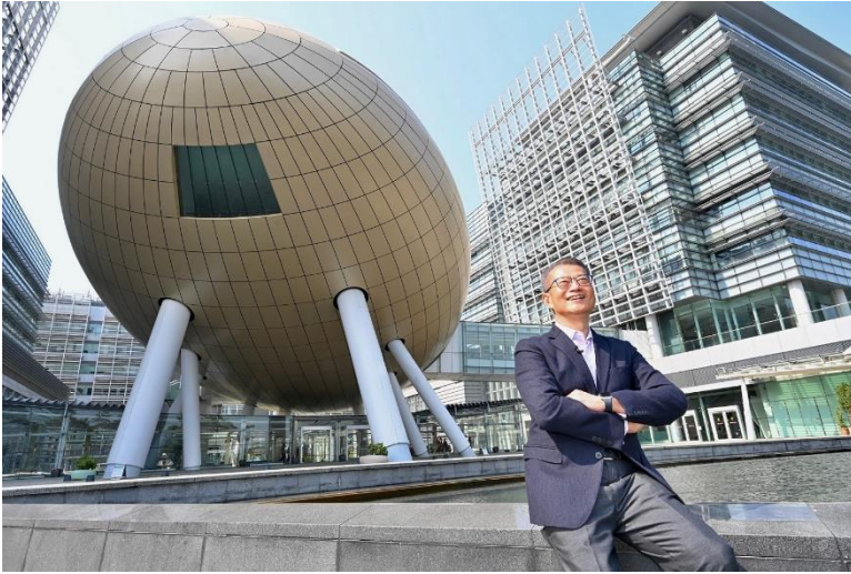
图一：财政司司长陈茂波到访科学园，与绿色科技初创交流，推动香港绿色发展。