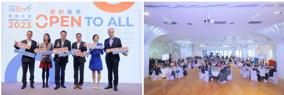
圖一和二：科技園公司舉辦以"Open to All"(開創無界)為主題的傳媒午宴，管理層於席上向傳媒分享科技園公司的願景及最新發展。

科技園公司管理層向傳媒分享公司願景及最新戰略發展，包括創新製造(新型工業化)以及創科人才計劃等；場內亦設有園區公司領先全港的突破性創新方案，包括人工智能應用及香港創新、設計和製造的食品和健康科技等。