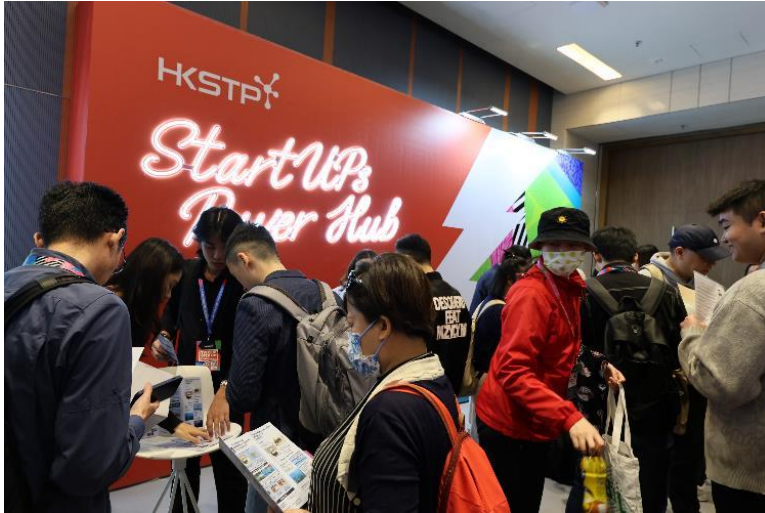
圖六：大會今年設立全新「StartUP Power Hub」區域，讓有志創業的年輕人，向現場超過 30 位初創公司創辦人取經。