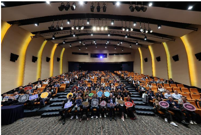
圖七：大會特別為非本地人才舉辦「就業創業分享會」，共同探索創科的無限可能，了解香港創科的獨特優勢、蓬勃的創科生態圈帶來的機遇，及科技園對世界各人地人才提供的多元化支援。