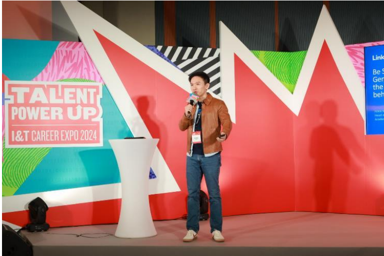
圖四：LinkedIn 透過分析平台的大數據及演算法，協助求職者制定策略，如何獲 AI 及招聘人員「垂青」，大大增加受聘機會。