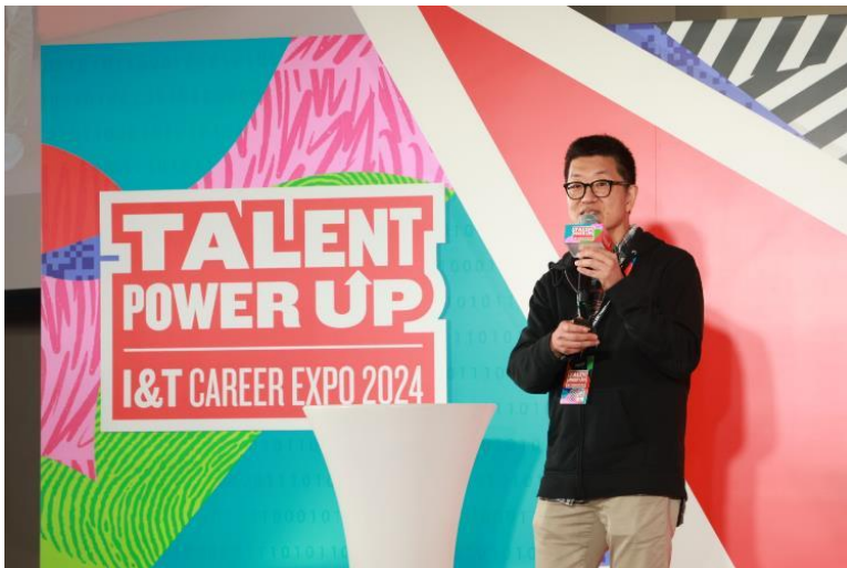
圖五：Google 策略顧問預測 2024 年 Gen AI 對各行各業的影響，讓參加者及早掌握優勢。