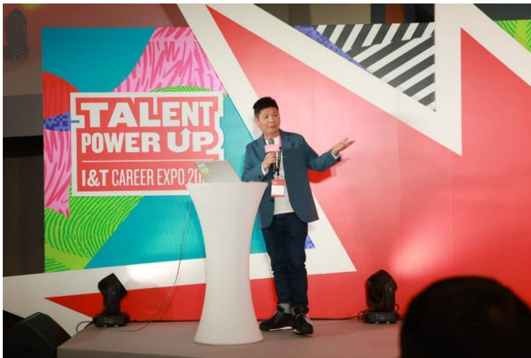
圖三：AWS 為求職者舉辦 AI 101 工作坊，提供 AI 入門知識和使用技巧。