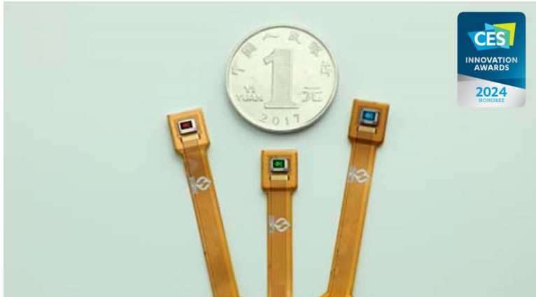
圖二：由思坦國際半導體有限公司研發的「0.13" micro-LED 顯示模組」具有超高像素密度 (10,000ppi)，為 AR/XR 產品顯示單元提供高亮度、長壽命、高效率的優勢，亦榮獲「CES 2024 創新獎」(XR 技術及配件)。