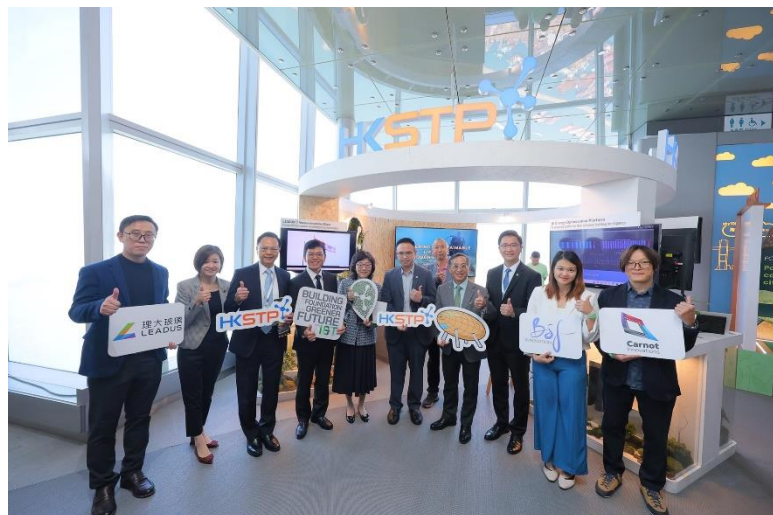
圖一：發展局局長甯漢豪參觀科技園公司於 GCSFE 2023 上設立的「以創新科技建構綠色未來基石」展館，了解三間園區公司的創新綠色方案。