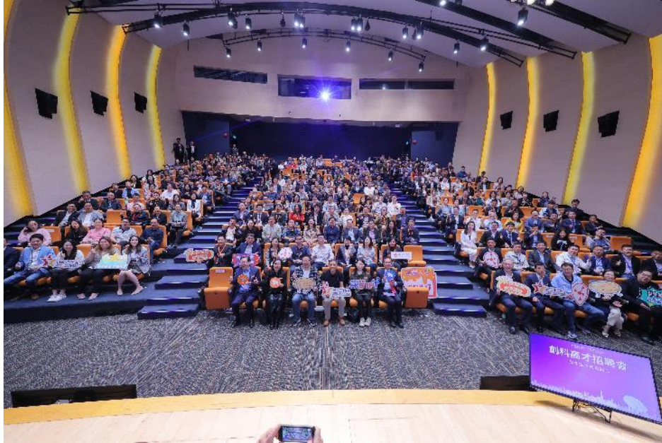
圖七：招聘會廣邀近 300 位高才參加。