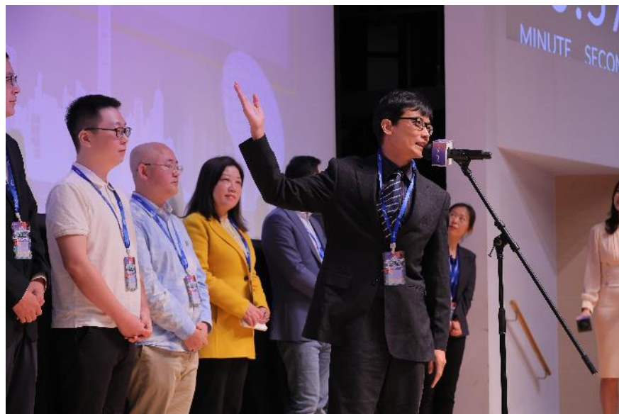
圖五：招聘會設多個互動環節，一眾高才在「超級高才秀」分享發展期望。