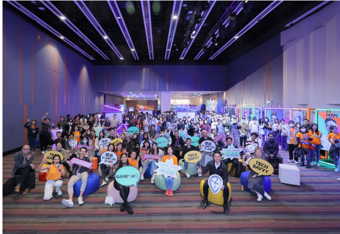
圖三：科技園公司一直積極吸引及培育人才。自香港實施「高端人才通行證計劃」後，科技園公司響應政府政策，全方位吸納人才。圖為去年的大型創科職業博覽。