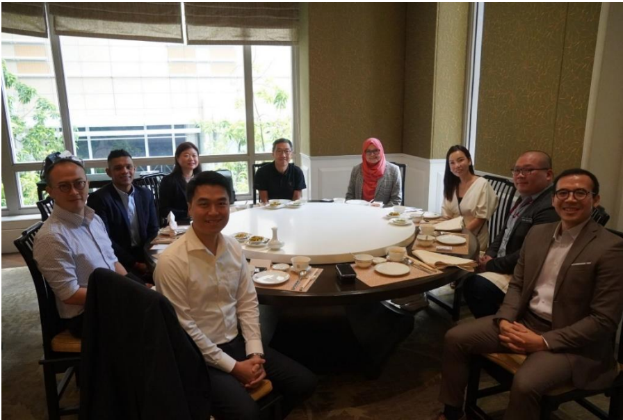
圖九：科技園領導團隊與馬來西亞科學工藝創新部代表共進午餐。