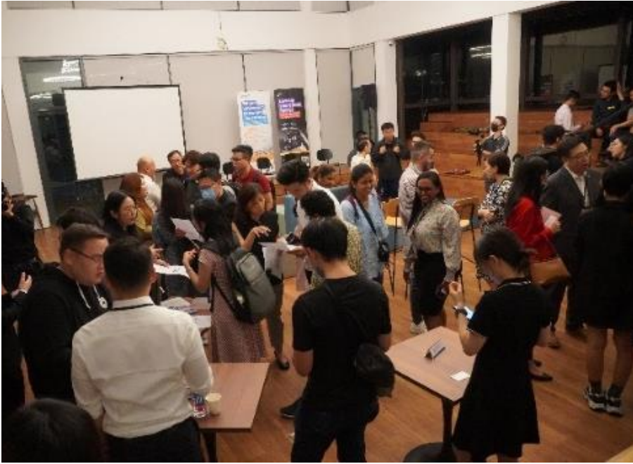
圖一至三：「Tech Talent Ignite」活動反應熱烈，出席人士包括來自香港具國際級規模的初創。