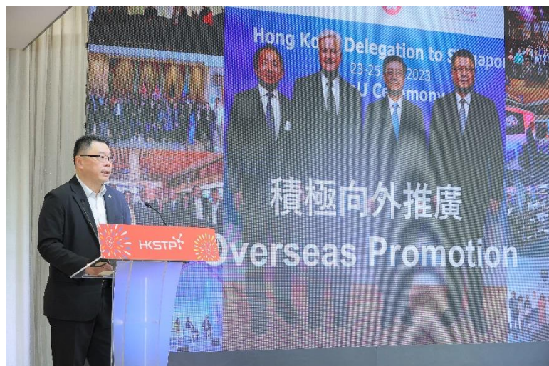
圖二：香港科技園公司主席查毅超博士總結，2023 年是成果豐碩的一年，園區公司數目由去年初大約 1,200 間到年底增加到 1,700 間，增幅超過四成。科技園公司團隊亦到訪海外多個國家進行訪問及交流，開拓海外及國際市場。