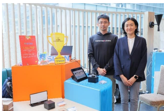
思坦國際半導體有限公司