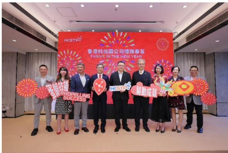
圖一：香港科技園公司舉辦傳媒春茗，管理層於席上向傳媒回顧科技園公司 2023 年豐碩的工作成果及分享今年的願景及最新發展概況。

展望新的一年，科技園公司會繼續建構蓬勃的創科生態圈，並協助園區公司吸納創科人才、助它們把科研成果商品化、吸引資金，助它們快速成長，驅動更多創科成就，助力香港向成為國際創科中心的願景進發。