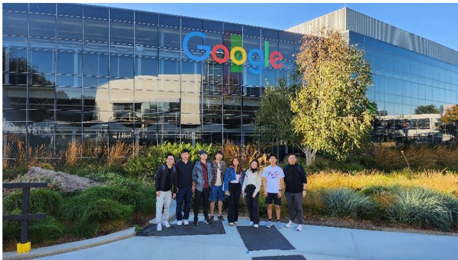
圖一：「Talent Game On 2K23」活動優勝者參觀美國谷歌總部。