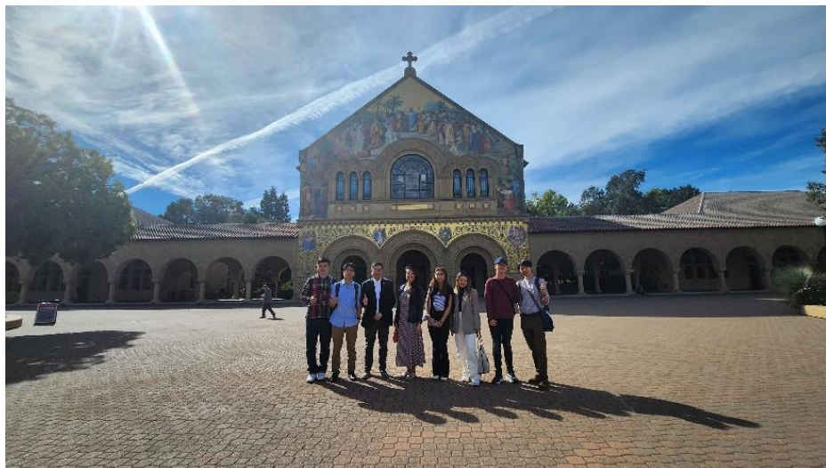
圖三：優勝者參觀史丹福大學。他們表示矽谷之行讓他們在生涯規劃方面獲得啟發。