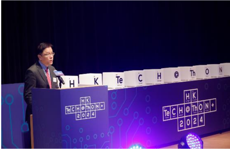
圖 2：香港特別行政區政府創新科技及工業局局長孫東教授表示：「我很高興看到近 1,500 名年輕人組成近 250 個本地和海外團隊，分享他們的創新想法和解決方案。這是科技園公司首次引入非本地合作夥伴，與來自 10 多個海外知名機構攜手，帶來 70 多名海外學生及參加者，讓 HK Techathon+ 2024 成為一個世界級的活動。政府透過創新及科技基金為初創提供一系列的資金和支援，加上於去年十月推出的 100 億港元 RAISE+ 計劃，旨在加速推動『從一到 N』的科研成果轉化。作為通往中國內地和亞洲的最佳跳板，香港擁有培育創新理念的一切所需，也是把業務拓展至中國內地和亞洲市場的理想平台。讓我們與一眾年輕人一起打造香港成為更具活力的國際創科中心。」