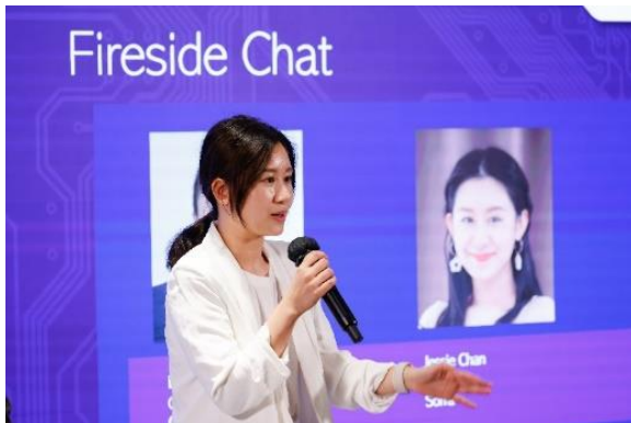
圖 5a 至 5c：科技園公司邀請到本地領先初創企業「Alphabag」、「Asynk」（圖 5a）、「Cloudbreakr」（圖 5b）和「Sorra」（圖 5c）的代表出席「青年初創領袖分享」。