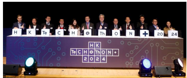
圖 1a 至 1b：由香港科技園公司與十所本地院校合辦的年度大型學界創科盛事 HK Techathon+ 2024 於今天正式揭幕，香港特別行政區政府創新科技及工業局局長孫東教授，以及香港科技園公司首席企業發展總監姚慶良博士工程師出席擔任主禮嘉賓。