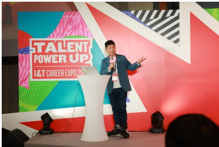
图三：AWS 为求职者举办 AI 101 工作坊，提供 AI 入门知识和使用技巧。