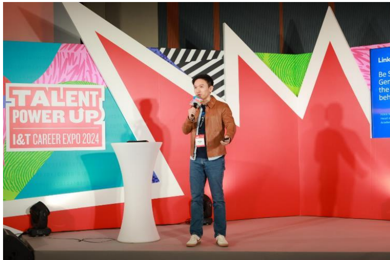
图四：LinkedIn 透过分析平台的大数据及演算法，协助求职者制定策略，如何获 AI 及招聘人员「垂青」，大大增加受聘机会。