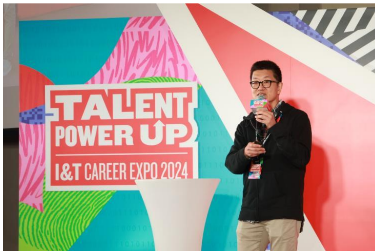
图五：Google 策略顾问预测 2024 年 Gen AI 对各行各业的影响，让参加者及早掌握优势。