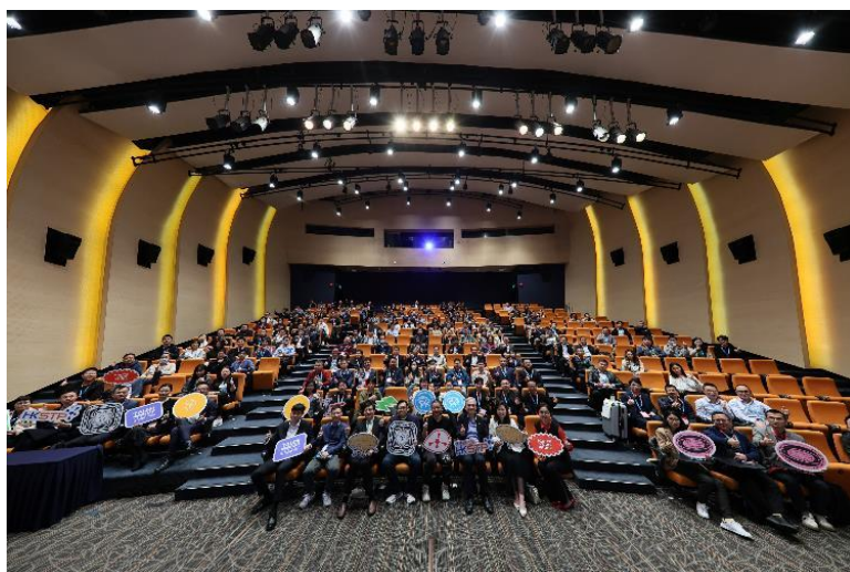
图七：大会特别为非本地人才举办「就业创业分享会」，共同探索创科的无限可能，了解香港创科的独特优势、蓬勃的创科生态圈带来的机遇，及科技园对世界各人地人才提供的多元化支援。