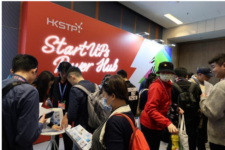
图六：大会今年设立全新「StartUP Power Hub」区域，让有志创业的年轻人，向现场超过 30 位初创公司创办人取经。