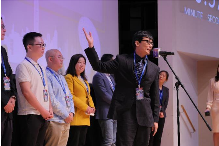
图五：招聘会设多个互动环节，一众高才在「超级高才秀」分享发展期望。