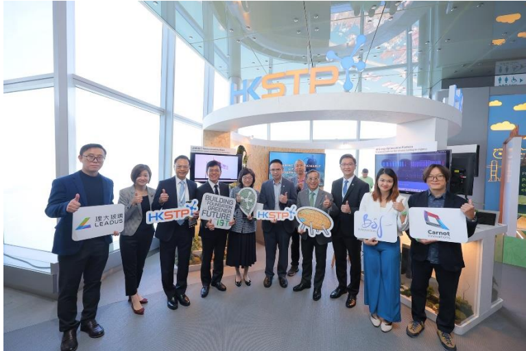
图一：发展局局长宁汉豪参观科技园公司于 GCSFE 2023 上设立的「以创新科技建构绿色未来基石」展馆，了解三间园区公司的创新绿色方案。