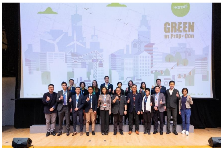
图五：一众支持机构出席「Green in Prop+Con」启动仪式，携手实现绿色科技推动可持续发展。