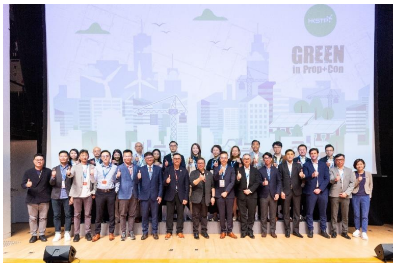
图六：超过 25 间企业伙伴参与「Green in Prop+Con」，协力长远改善房地产与建筑业的可持续发展表现。