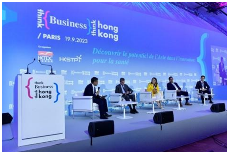
图八：科技园公司主办「释放亚洲医疗保健创新机遇」专题讨论环节，由香港科技园公司行政总裁黄克强先生主持（左一），与生物科技领袖探讨香港和法国两地的生物技术生态圈之间所蕴含的合作潜力，推动新并创拓展全球市场机遇。演讲者包括（由左至右）：