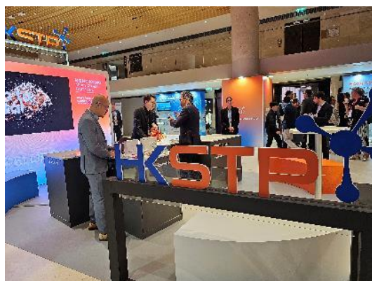
图一及二：科技园公司于 9 月 19 日参加由香港贸易发展局在法国巴黎罗浮宫卡鲁塞尔商廊举办的「成就机遇·首选香港」活动，展示香港将创新成果落地，推出国际市场的实力。