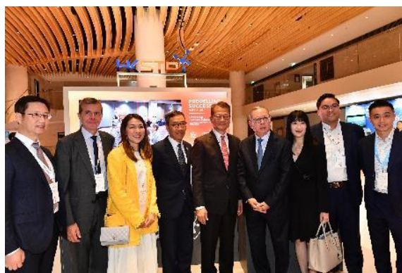
图三至六：香港财政司司长陈茂波先生参观香港科技园公司展区，了解香港生物科技和医疗保健行业的最新产品及应用方案。