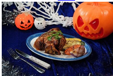
Harbourview Grill 脆皮猪手配烤蔬菜