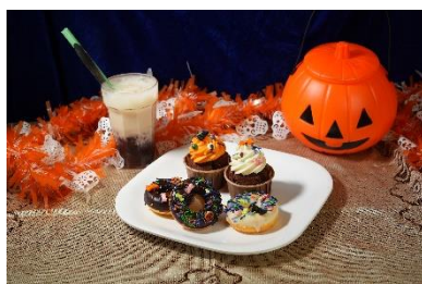
SMACK 万圣节主题 Cupcakes 配红豆冰