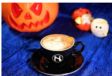
Nuk Café 香橙朱古力咖啡