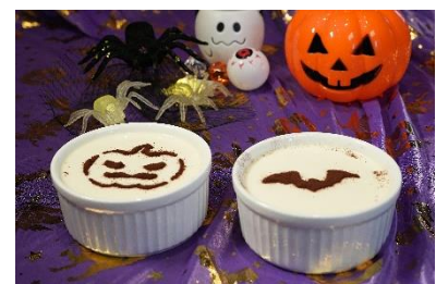
爱味道 万圣节奶冻