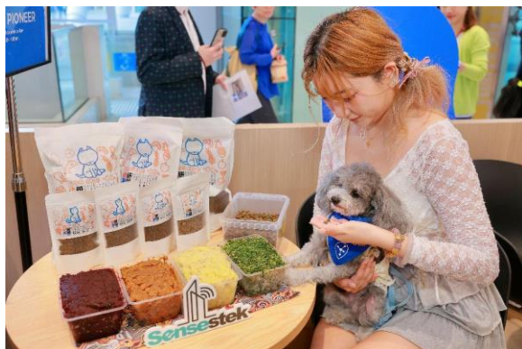
图八：由舜达科技研发的「果研系粮」宠物食品由精心挑选的厨余制成，为宠物提供蕴含丰富天然营养的核心配方。