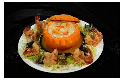
八方栈 法式凤尾虾球南瓜盅