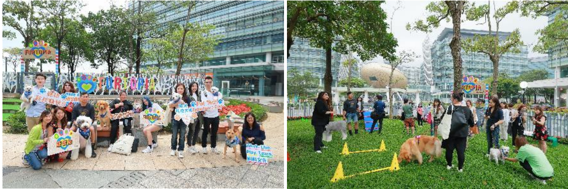
图九至十：所有「宠物科技大使」及其主人均可成为宠爱点的首批用家。