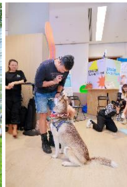
图六至七：于「宠物科技体验日」，Paws United Charity 专业人员提供犬只训练工作坊。