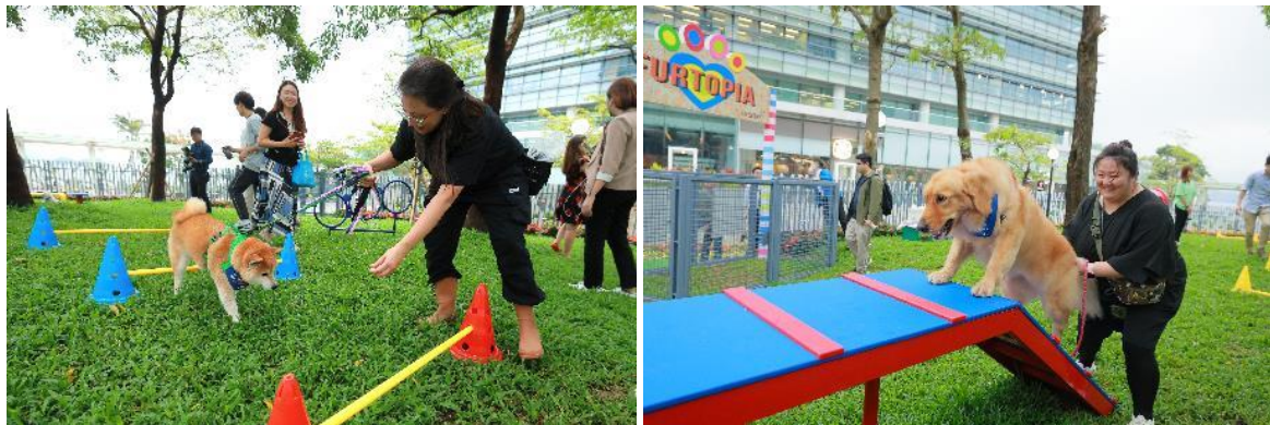
图一至二：宠爱点设有多项宠物友善设备，满足宠物的游乐及训练需要。