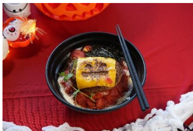
グルメ三木屋 鬼马芝士和风汉堡井