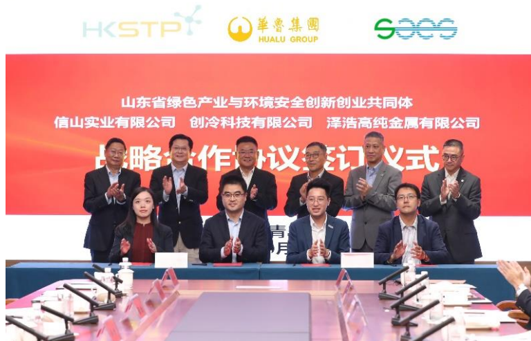
图二：香港科技园园区公司泽浩高纯金属有限公司、创冷科技有限公司及信山实业有限公司于行程期间，与华鲁集团旗下山东省环科院牵头建设的「绿色产业与环境安全创新创业共同体」签署合作协议，加入当地绿色生态圈，共同以创新科技推动山东省的可持续发展。