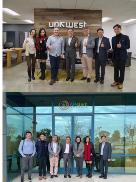
图五至七：科技园公司代表团到美国展开 Innovation Mixer 交流活动，期间与硅谷科技巨头谷歌、以色列创业加速器 UPWEST LABS 及生物科技企业 APstem THERAPEUTICS 等代表会面。