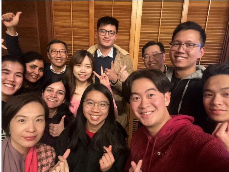
图一：超过 50 名史丹福大学学生参与就业信息活动。香港科技园公司行政总裁黄克强向逾 50 位不同学系的史丹福学生，介绍香港创科的前景，及科技园公司提供的实习和就业机会。