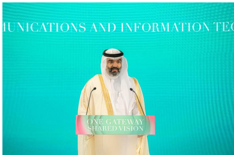
图四：沙特阿拉伯通讯与信息技术大臣 Abdullah Al-Swaha 在活动上进行分享。