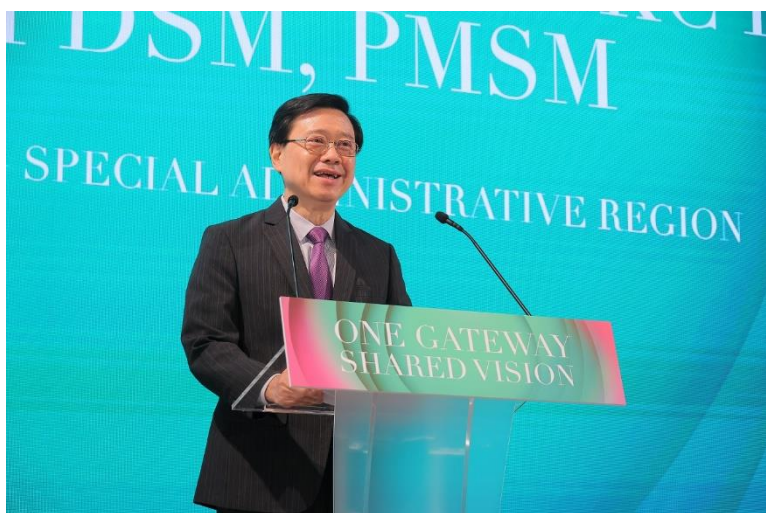
图三：行政长官李家超今日出席「One Gateway Shared Vision - Hong Kong Special Administrative Region x Kingdom of Saudi Arabia」活动，并在活动中致辞。