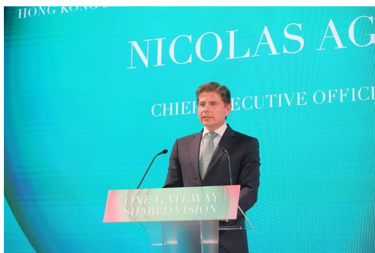
图七：香港交易所集团行政总裁欧冠升在活动上发表主题演讲，分享沙特阿拉伯科技企业到港上市的机遇。