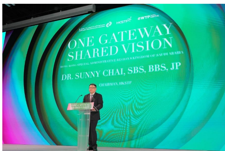
图五：香港科技园公司主席查毅超博士致欢迎辞。